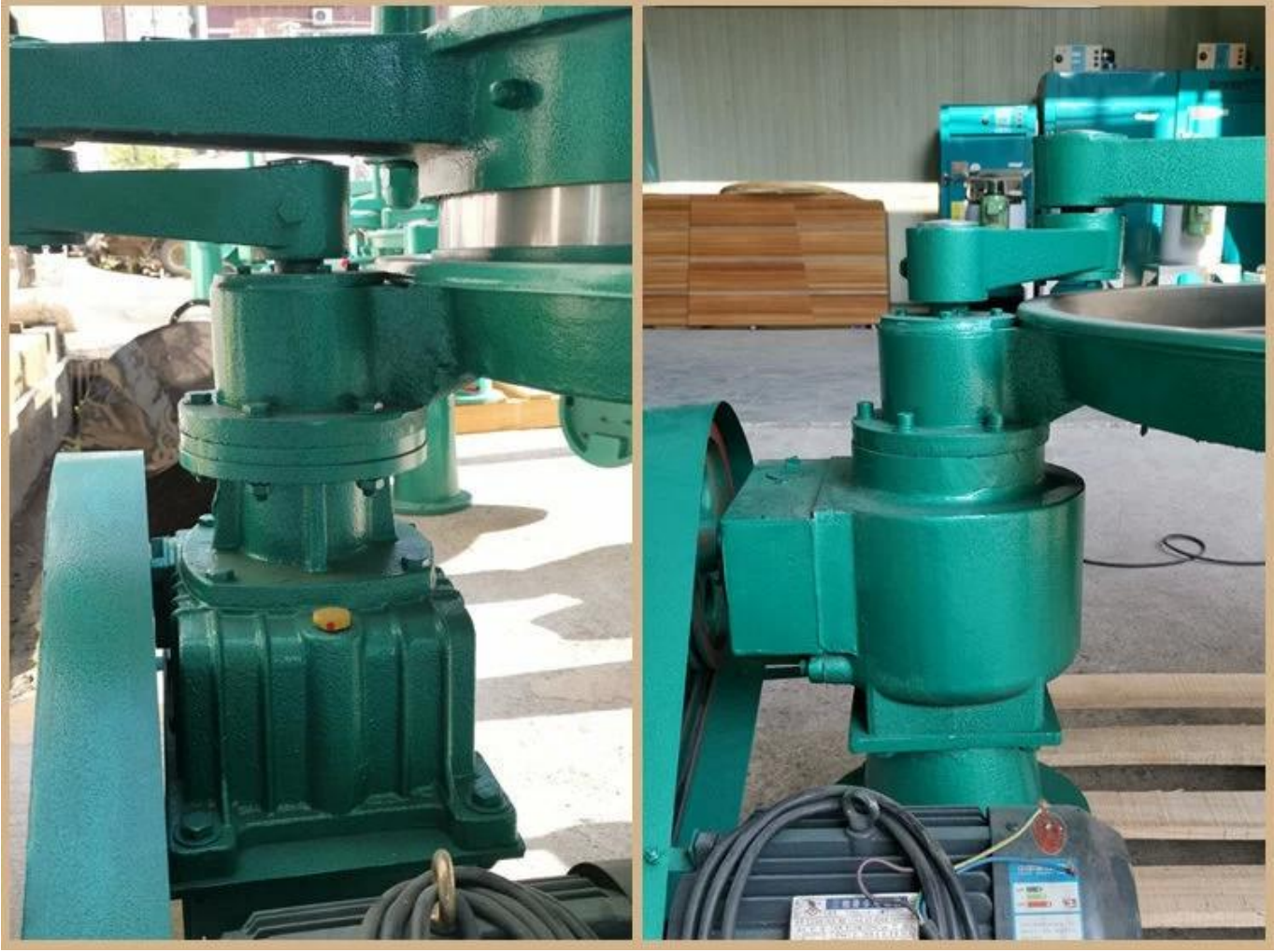
Türbin qurd dişli qutusu dizaynı, yavaşlama sabit və davamlıdır.