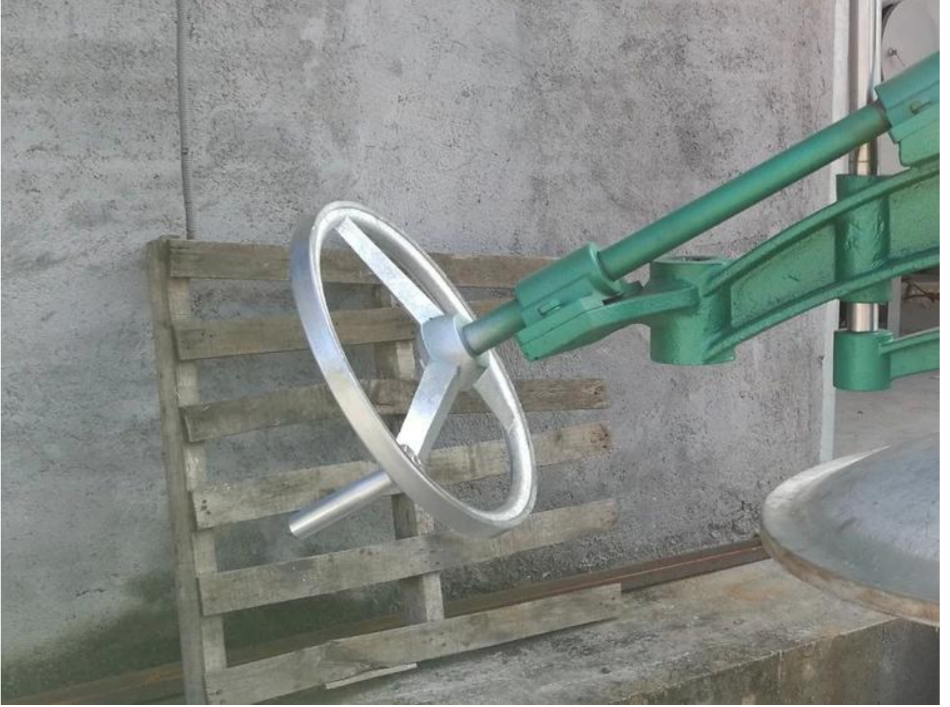
Geniřlendirilmiř el arxı dizaynı, barel qapađının daha srətli qaldırılması.